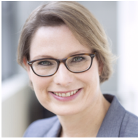
Dr. Stefanie Hubig Ministerin für Bildung